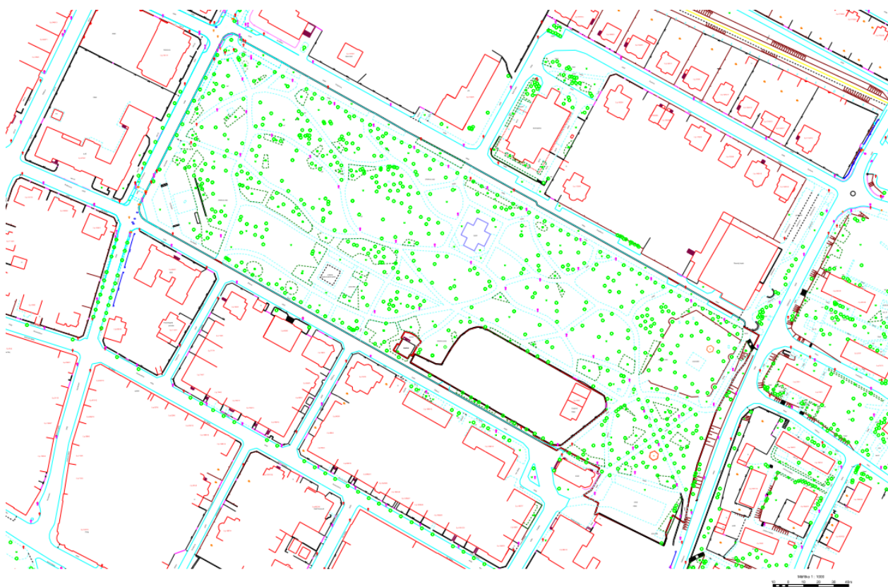
Obrázek 2 – hranice řešeného území

Součástí řešeného území není plocha dětského dopravního hřiště.