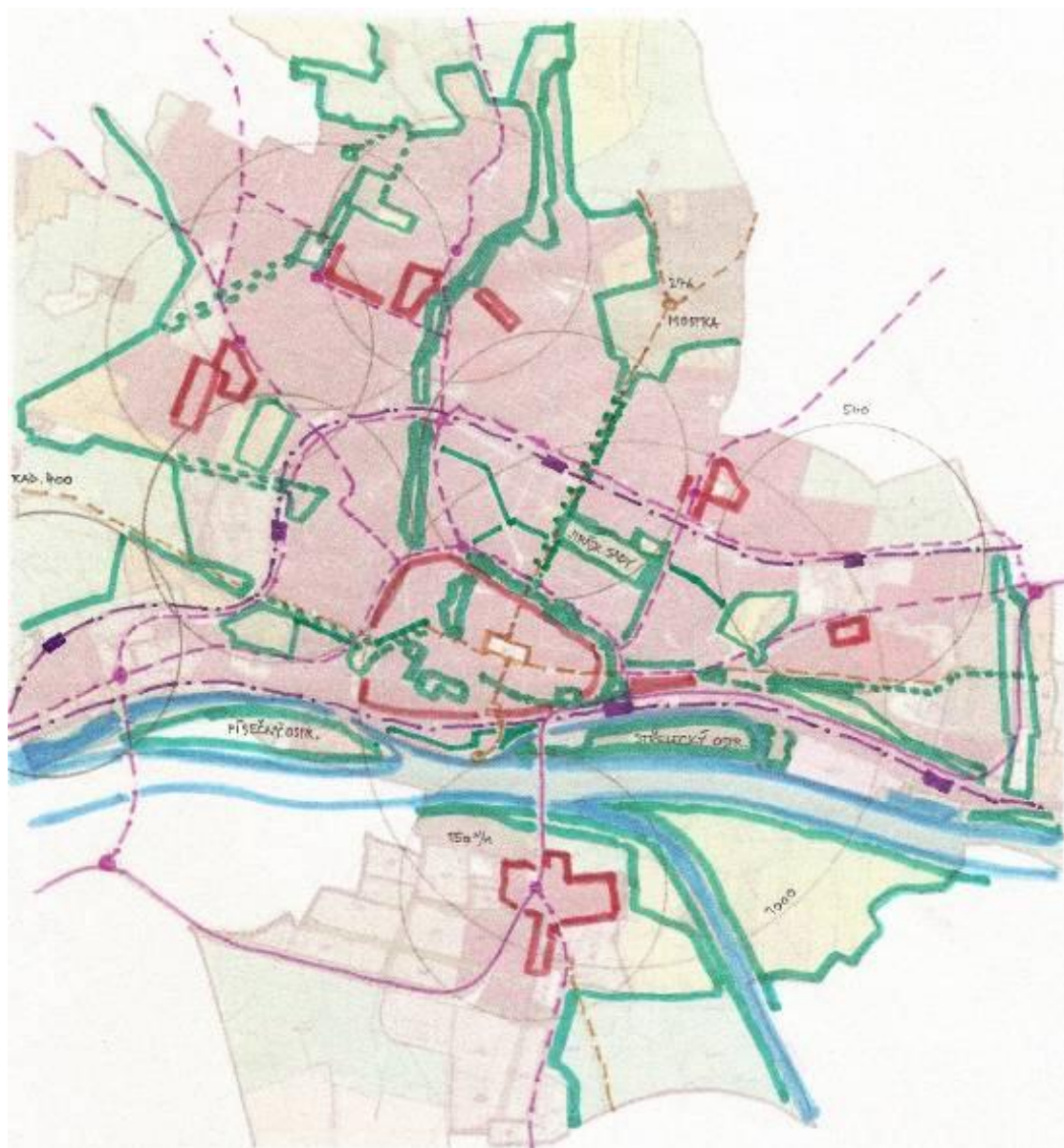
Obrázek 1 – základní uspořádání organismu města

Park je obklopen architektonicky hodnotnými budovami, převážně školami, s významným podílem zeleně na jejich parcelách. Díky své poloze je park snadno dostupný především z vnitřních částí města.